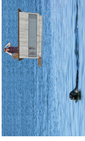
SeaShelter ved flod