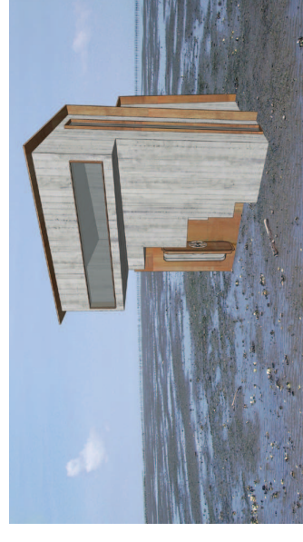
SeaShelter ved ebbe